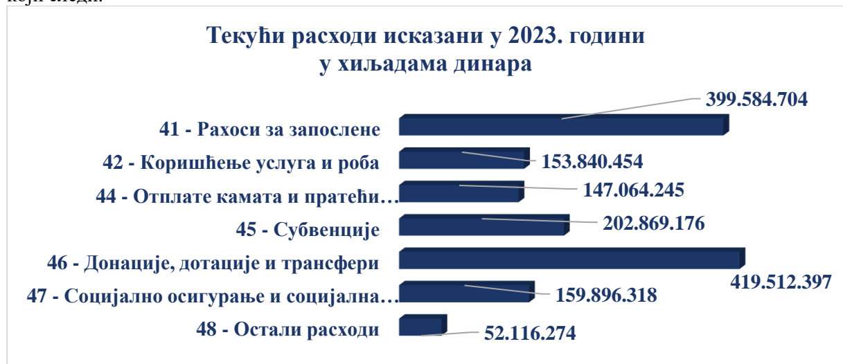
Графикон 3: Текући расходи у 2023. години по категоријама економских класификација

Текући расходи исказани су у Извештају о извршењу буџета у периоду од 01.01.2023. до 31.12.2023. године у износу од 1.534.883.568 хиљада динара (у 2022. години 1.289.937.826 хиљада динара), у оквиру категорија економских класификација како је приказано у графикону који следи.