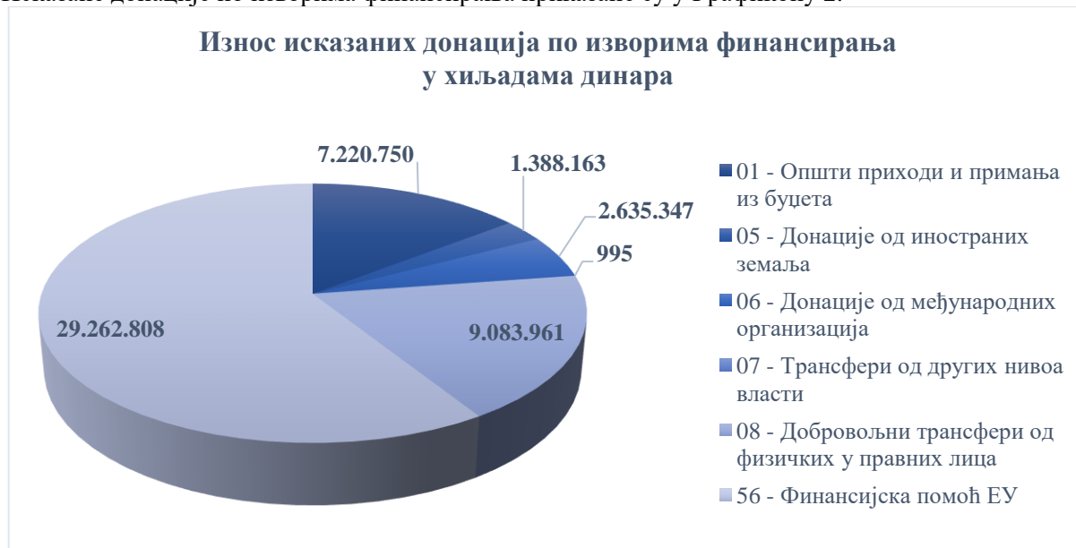
Графикон 2. Исказане донације по изворима финансирања

Исказане донације по изворима финансирања приказане су у Графикону 2.