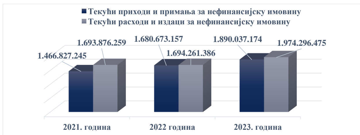
Графикон 1. Приходи и примања од продаје нефинансијске имовине и расходи и издаци за нефинансијску имовину евидентирани у Главној књизи трезора по годинама

Упоредна анализа евидентираних и исказаних прихода и примања од продаје нефинансијске имовине и евидентираних и исказаних расхода и издатака за нефинансијску имовину по годинама дата је у Графикону 1.